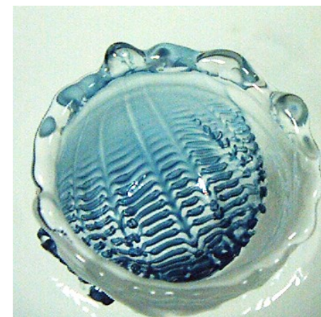
Регулярная структура течения растекания составной капли в воде (Изв. РАН. МЖГ, 2024)